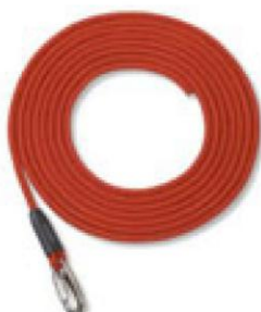
112100 Redcord kotel, piros, 5m, karabinerrel