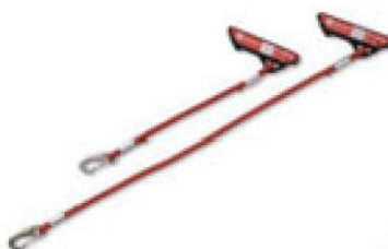
112001 / 112020 Redcord kotel, piros, 30/60 cm