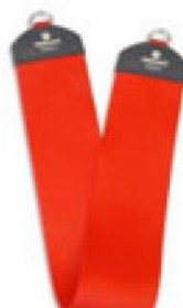
111002 Redcord keskeny függesztő heveder függesztőgyűrűkkel