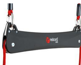
110030 Redcord Axis