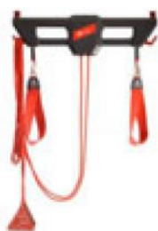
110010 Redcord Trainer