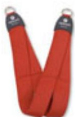
12037 Redcord osztott függesztő heveder függesztőgyűrűkkel