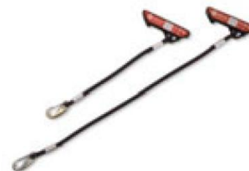
12261 / 12260 Redcord gumikötél, fekete, 30/60 cm, kis/nagy ellenállás