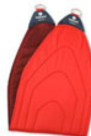
111001 Redcord széles függesztő heveder függesztőgyűrűkkel